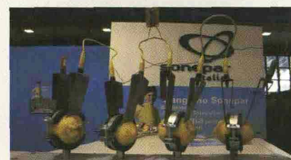
Alcuni momenti dell'edizione 2008 di EnergyMed